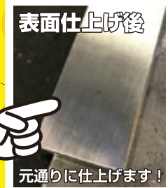
元通りに仕上げます！